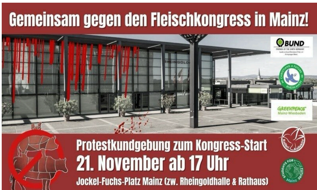
Abbildung 2: Aktionsposter zur Protestkundgebung.

Interpretation ist ein fortlaufender Prozess innerhalb der Bewegung wie auch im gesellschaftlichen Diskurs. Die Aktivist:innen deuten ihr Engagement als moralisch gerechtfertigt und notwendig. Die Gegenseite wird als unmoralisch klassifiziert. Diese Deutung wird nicht nur argumentativ, sondern auch performativ und visuell gestützt.