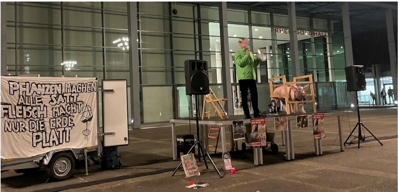
Abbildung 1: Foto der Bühne; Quelle: Greenpeace Mainz-Wiesbaden (2023).

Die Auswahl und gezielte Verlesung von Programmpunkten des Kongresses, wie in dem folgenden Auszug deutlich wird, wird genutzt, um den Fleischkongress als eine Art Verschwörungstreffen der Fleischindustrie zu inszenieren, das Menschen bewusst zu mehr Fleischkonsum verführen soll. Die Bühne wird zum performativen Raum kollektiver Selbstvergewisserung, in dem Werte sichtbar und normativ aufgeladen werden.